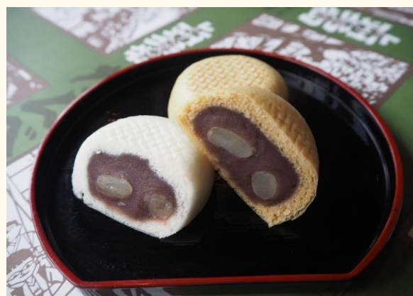
上州名物「だんべえ饅頭」は、上州人の素朴な気質や、べえべえ言葉にちなんで生まれた薄皮饅頭です。

明治31年創業のだんべえ総本舗風間堂は、高崎市連雀町の地で創業したのが始まりです。5代にわたり受け継がれてきた和菓子作りの心意気を大切に伝統を守りつつも親しみのある和菓子を今日もかわらずに作り続けています。