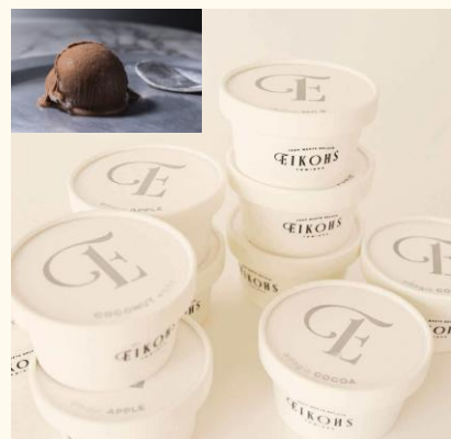
EIKOHSの人気フレーバーたちがカップジェラートに。

半世紀続く精密機器工場の次なる挑戦は、なんと“至福”のジェラート&スイーツ作り！2代目と3代目（アトツギ）が、ものづくりで培われてきた技術を活かし、思いを込めて一から手掛ける自信作。こだわり抜いたスイーツと至福のひとときをお楽しみください♪