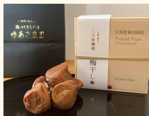
ヴィンテージ梅干しならではの、味と香りが楽しめます。