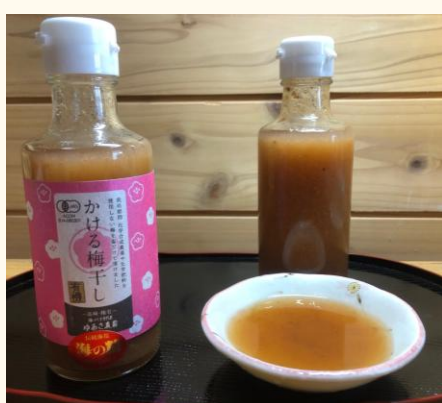
練り梅と梅酢を合わせた、ドレッシングタイプの梅干しです。