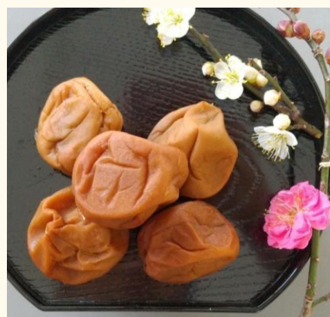
有機栽培の梅を、伊豆大島産「海の精」で漬け、天日干しました。

日本で唯一、有機JASとJGAPを取得している梅農家で、高崎市榛名地域で大正時代から5代100年に渡り梅の栽培・加工をおこなっています。梅干しはもちろん、かける梅シリーズや特別な日の梅干しギフトなど、多様な梅商品を揃えてお待ちしております。