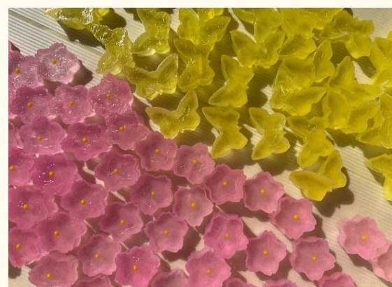
鮮やかな色彩と繊細な細工で四季を彩る和菓子です。