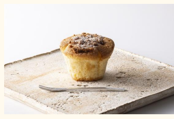
外はサクサク♪中しっとりの新作焼きスイーツ。その名もマバン。