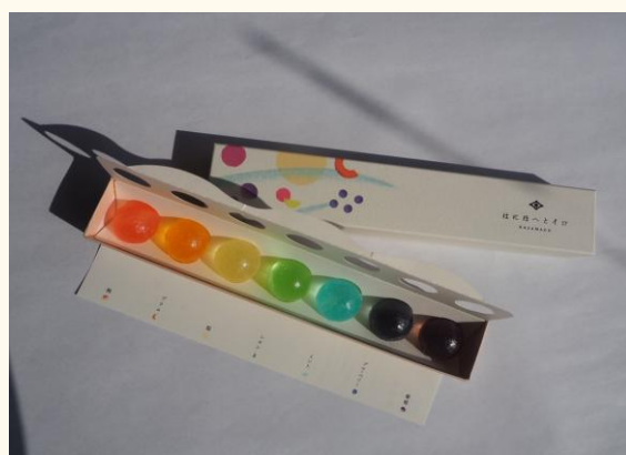
「音楽のある街・高崎」街を彩る音楽を7つの味の琥珀糖で表現しました。