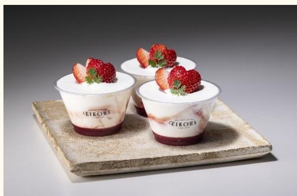
あまりんを贅沢に使用♪甘さと酸味の絶妙なハーモニーをお楽しみください。